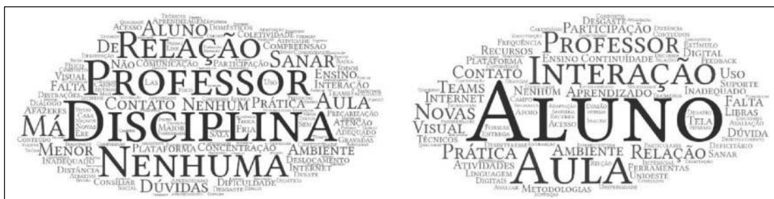
Figura 5: Experiência do ensino remoto emergencial dos Estudantes (esquerda) e Professores (direita)

Elaboração: Nedson Pedro Costa Junior (2023).