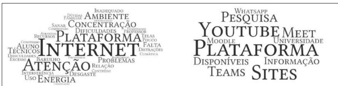
Figura 3: Recursos técnicos e tecnológicos dos Estudantes (esquerda) e Professores (direita)

Elaboração: Nedson Pedro Costa Junior (2023).