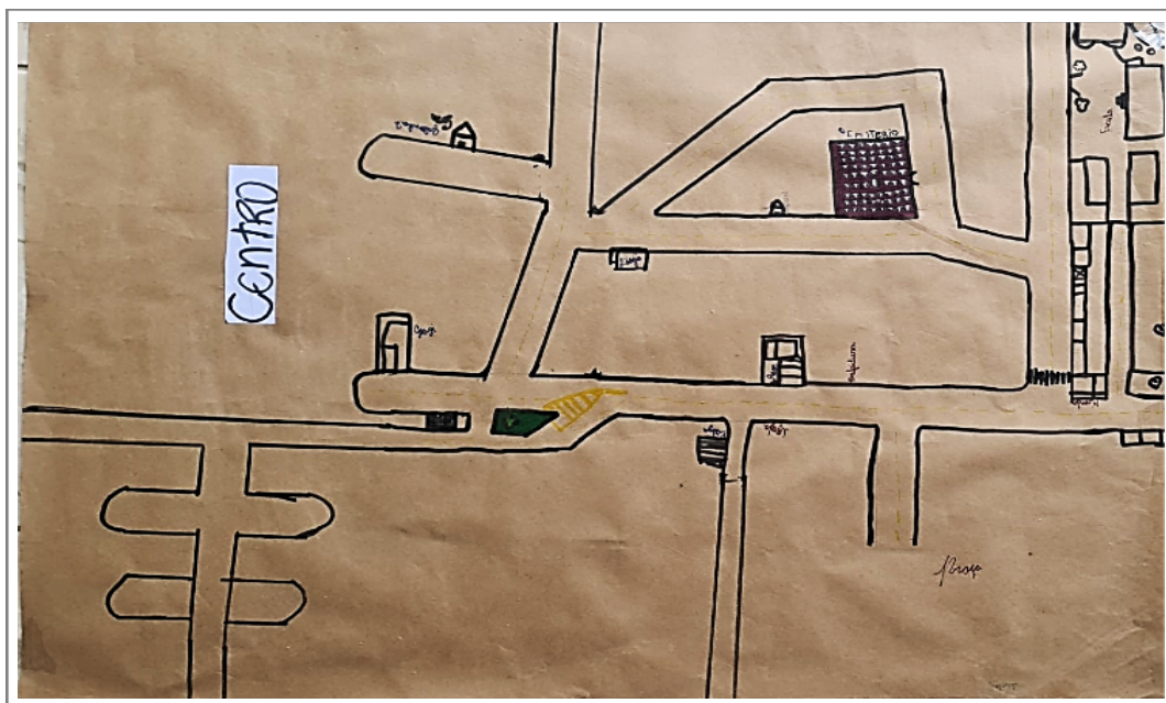
Figura 2: Mapa do centro (grupo 2)