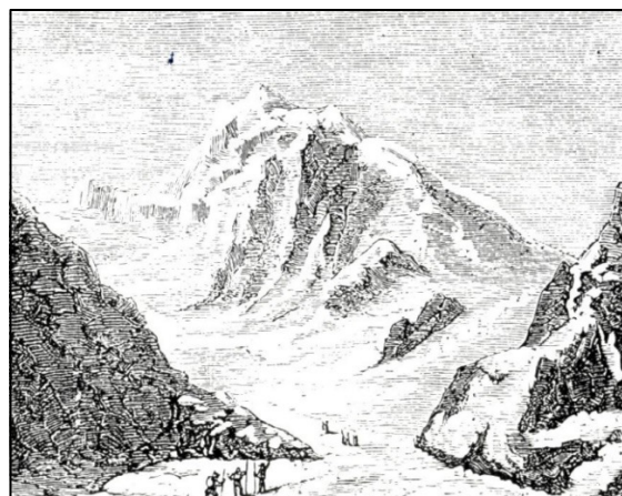
Figura 4: “Le Mont Blanc” Fonte: BRUNO, 1877, p. 85

A semelhança da trama em torno da viagem de personagens crianças protagonistas de aventuras dignas de “gente grande” que se nota em ambas as narrativas é bastante significativa, porém não definitiva, para confirmar a hipótese de que o autor brasileiro tenha contatado o texto francês. Ambas as personagens humanas das narrativas movem-se no espaço e no tempo da trama sem a presença efetiva de seus tutores, ainda que auxiliados por outras personagens coadjuvantes; também, estas personagens engajam-se em aventuras de grandes dimensões do ponto de vista da necessidade de responsabilidade, de autonomia e de maturidade, amparadas por dicas e conselhos de sobrevivência e moral, sobretudo.