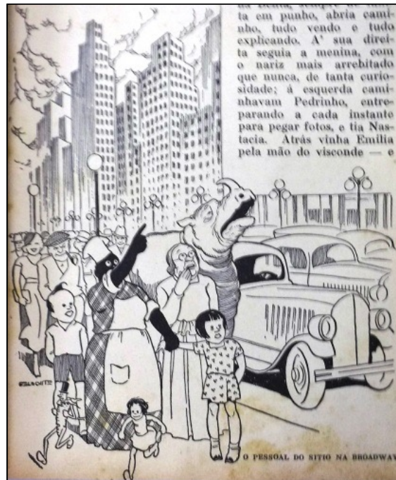
Figura 2: “O pessoal do sítio na Broadway”. A figura que ilustra a passagem das personagens pelos Estados Unidos não se exime da expressão do pensamento do autor correspondente na palavra escrita: para além de contemplar Nova York, ao leitor, vê-la poderia soar como desejá-la. Embora com sua literatura de muitas aberturas para um novo pensamento espacial, Lobato também pode ter contribuído com um movimento de “enrijecer identidades”.(LOBATO, 1935, p. 109)

Um primeiro ponto de convergência entre as narrativas analisadas aproximam-nas quanto ao teor de sua origem ideológica. São narrativas que nascem com propósitos semelhantes, porém, tecem-se sob pontos de vista distintos, especialmente quando analisadas à luz da língua e da linguagem que empregam. Na Geografia de Dona Benta, Lobato recupera pela oralidade o sentimento de experiência a ser vivida per si e não por outrem, ao que se pode encontrar algum resquício da atividade cartesiana do pensamento. Como aponta Jacinto (2015) os estudos literários em comunicação com o conhecimento geográfico associam-se pela ação do viajar, que atribui caráter de itinerância às narrativas: “[...] o cerne e elemento de ligação entre Literatura e Geografia é a viagem, que funciona para o escritor como o trabalho de campo para o geógrafo.” (JACINTO, 2015, p. 9). Pelo aspecto da viagem, vão se estabelecendo geograficidades que vão atribuindo ao leitor um senso de pertencimento e de posse dos locais que se vão visitando, como um modo de apropriação do bem-comum que é a pátria e que lhe possa despertar um sentimento de cuidado e de dever.