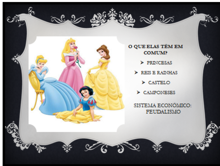
Figura 4: Caracterização do Feudalismo