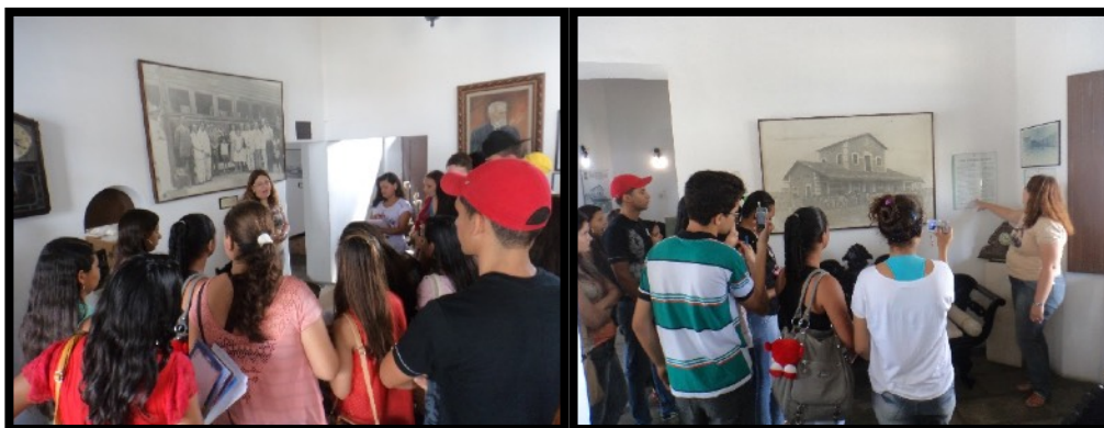
Figura 2 e 3: Palestrante apresentando a história do Museu