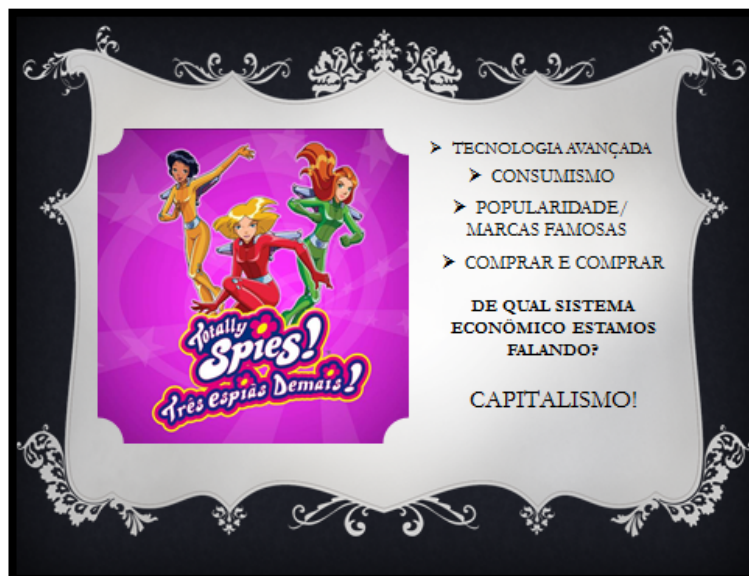
Figura 5: Caracterização do Capitalismo